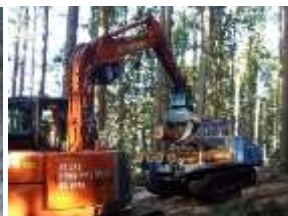
集材作業/運材作業

伐倒木の枝と梢を切り落とし、決められた寸法の丸太に細断する作業です。玉切り作業とも言います。