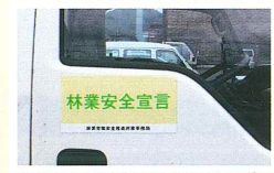
※のぼりとステッカー