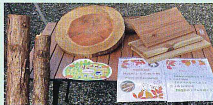
神流杉ができるまで

ツリーイング・木育ひろば おとなも子どもも みんなのワクワクを大切に 森や木と遊ぼう